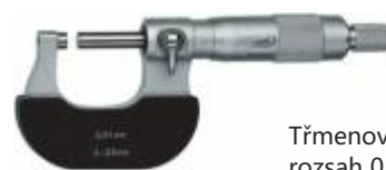
Třmenový mikrometr rozsah 0 - 25 mm / 0,01 mm obj.č: 800501