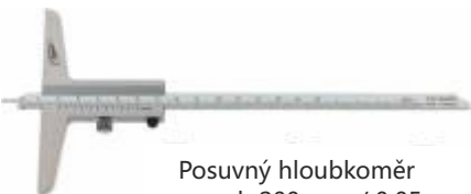
Posuvný hloubkoměr rozsah 200 mm / 0,05 mm obj.č: 282202