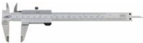
Posuvné měřítko rozsah 150 mm / 0,05 mm obj.č: 185501