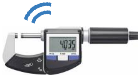
Digitální třmenový mikrometr IP65 rozsah 0 – 25 mm / 0,001 mm obj.č: 186641060