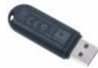
Rádiový přijímač i-Stick obj.č: 1998780