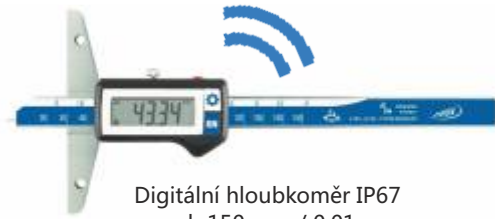
Digitální hloubkoměr IP67 rozsah 150 mm / 0,01 mm obj.č: 137141660