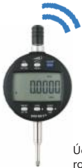
Úchylkoměr digitální rozsah 12,5 mm / 0,0005 mm obj.č: 172650260