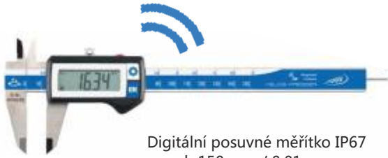
Digitální posuvné měřítko IP67 rozsah 150 mm / 0,01 mm obj.č: 132641660