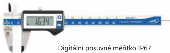
Digitální posuvné měřítko IP67 rozsah 150 mm / 0,01 mm obj.č: 1326416